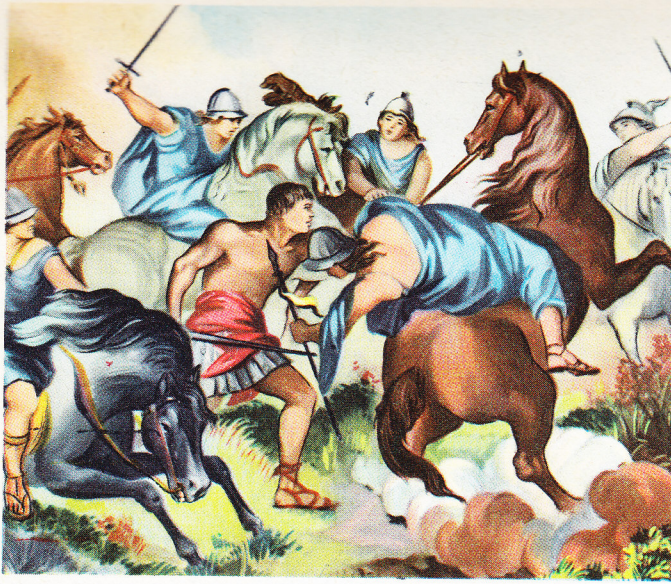
Les Amazones étaient des guerrières formidables, mais Bellérophon les vainquit également, tout en étant seul contre toutes.

aux frontières de la Lycie. Bellérophon les extermina sans trop de difficultés.