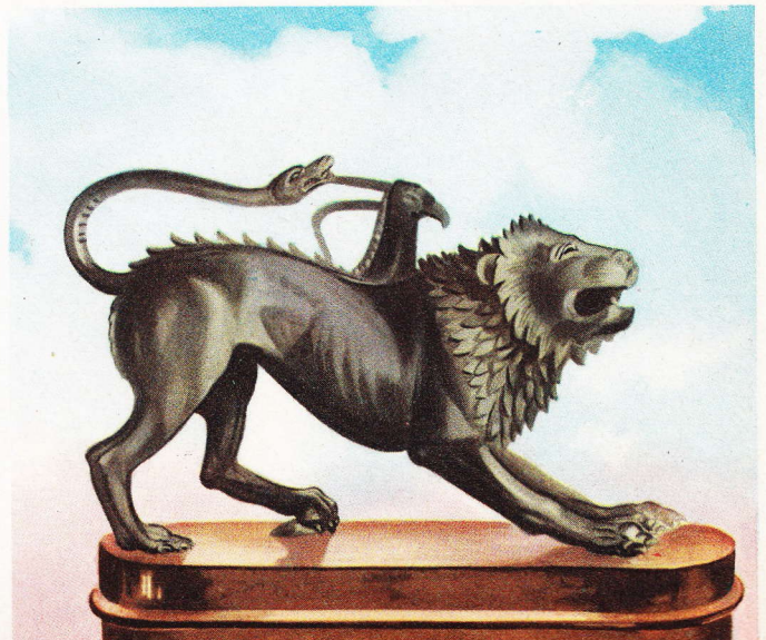
Cette statue, retrouvée à Arezzo et exposée au Musée archéologique de Florence, représente la Chimère, ce monstre fabuleux que Bellérophon eut mission de faire périr.