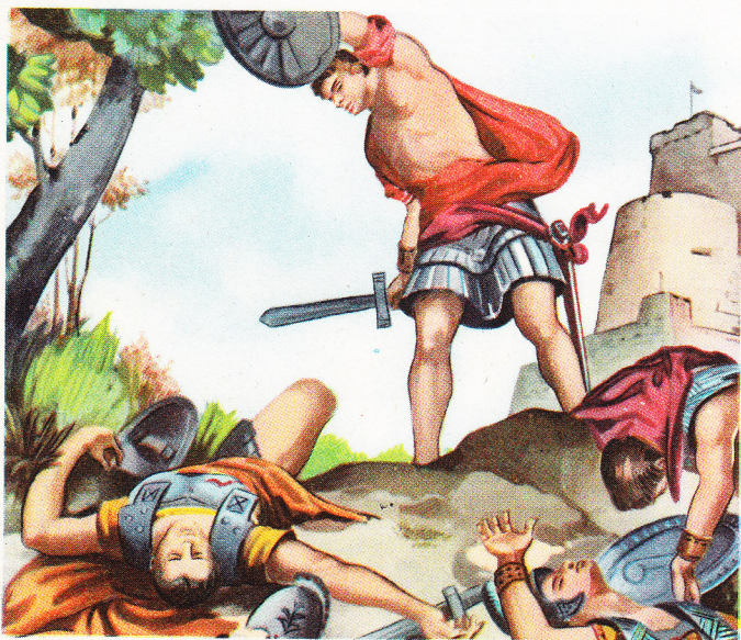
Tous les guerriers envoyés contre lui pour l'attirer dans une embuscade sont tués un par un par le vaillant fils de Glaucus.

Ce sont là les gestes de Bellérophon qui nous sont