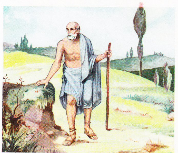
L'homme qui avait abattu la Chimère, mis en déroute les Solymes, vaincu les Amazones, termina sa vie dans la solitude absolue, car il était maintenant haï par les dieux.

contées par Homère; mais quelque autre poète est venu ajouter à ce récit un épisode de plus que nous allons narrer: Plus tard le héros retourna à Argos, et il invita sa perfide accusatrice à monter avec lui sur le dos de Pégase. La femme accepta, mais lorsque le cheval ailé vola au-dessus de l'océan, Bellérophon la précipita dans les flots, se vengeant ainsi de celle qui avait été à l'origine de toutes les entreprises que Iobate lui avait imposées. Cette vengeance cadre mal avec le personnage de Bellérophon qu'Homère nous a décrit par la bouche de Glaucus, neveu du héros et valeureux combattant de la guerre de Troie. Nous préférons nous en tenir à la poétique version d'Homère, qui rapporte, qu'ayant maintenant perdu la faveur des dieux, le vainqueur de la Chimère « seul et ravagé par la tristesse » errait dans la plaine Aléenne, une grande étendue de terre que Iobate avait donnée en dot à sa fille. Mais la raison pour laquelle les dieux en étaient venus à le détester, n'est dévoilée clairement ni par Homère ni