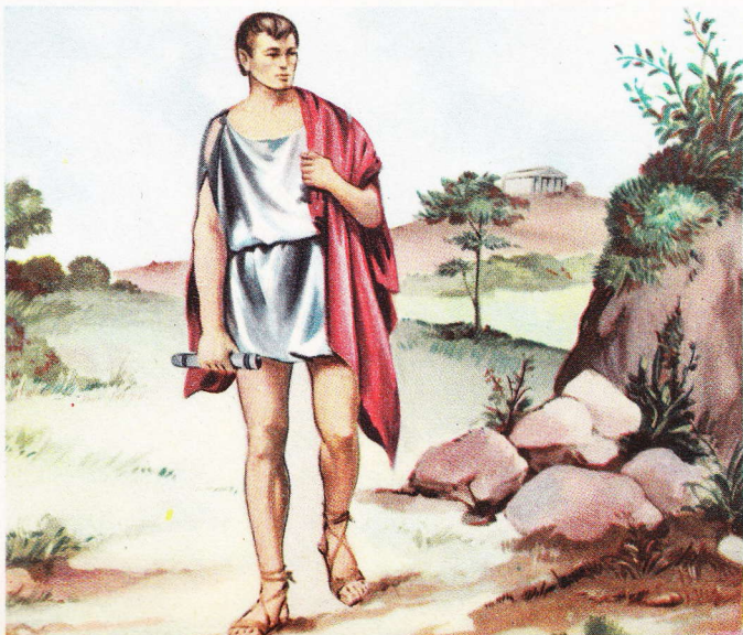
Obéissant à un ordre de Proetus, Bellérophon s'éloigne d'Argos pour se rendre en Lycie, sans se douter que la lettre cachetée qui lui a été confiée est sa condamnation à mort.

Mais le beau-père de Proetus ne se déclara pas satisfait de cet exploit et l'envoya combattre contre les Solymes, une race primitive et belliqueuse qui habitait